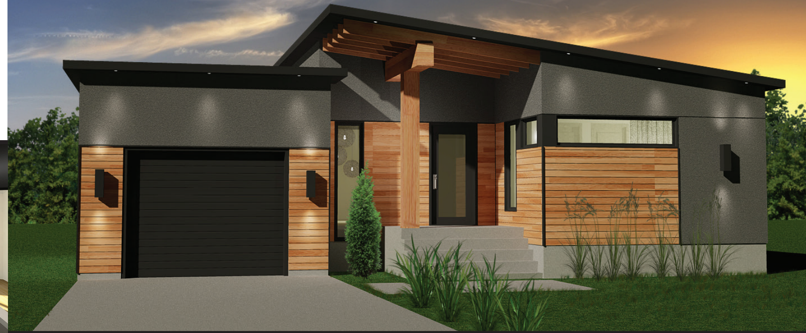
AVEC GARAGE / 42' X 46'-6" - 1438 PI 2