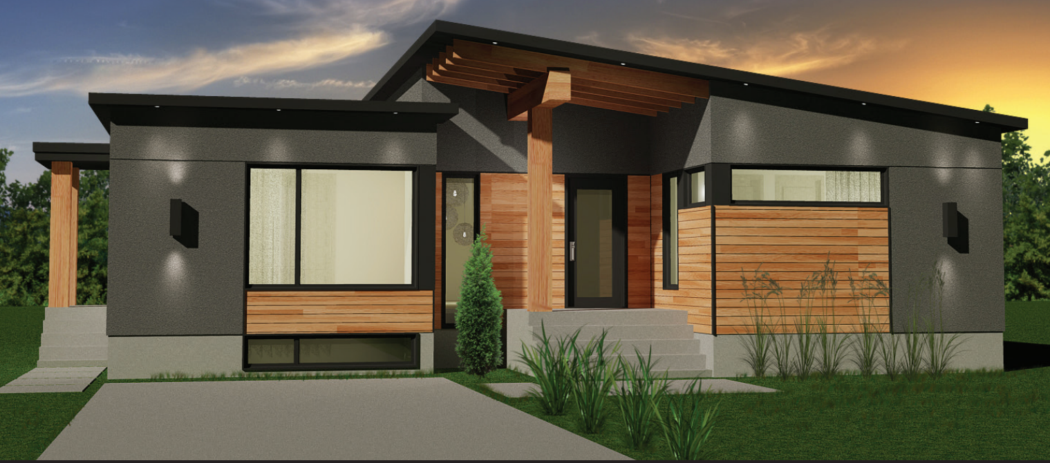
INTERGÉNÉRATION / 44' X 46'-6" - 1590 PI 2